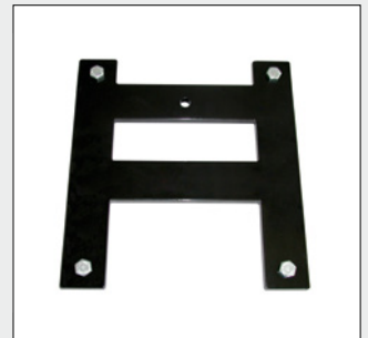
Ersatzradhalterung zum Anbau des TendoMat® am Geländewagen.