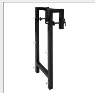
Bordwand-Halterung zum Einhängen an eine gerade Bordwand.