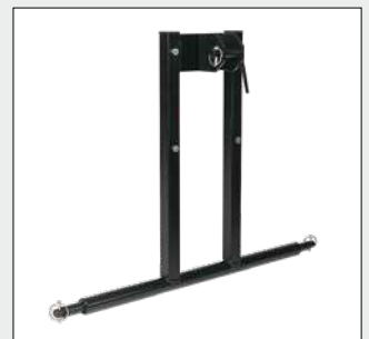
Dreipunktbock KAT 0, KAT I, KAT II zum Anbau an die Ober- und Unterlenker der Hydraulik.