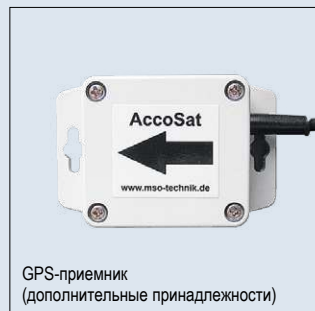
GPS-приемник (дополнительные принадлежности)