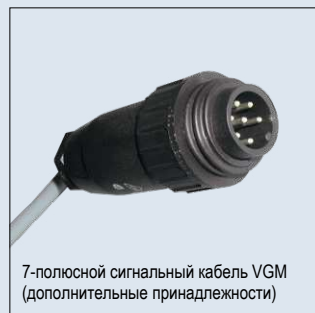
7-полюсной сигнальный кабель VGM (дополнительные принадлежности)

Данные о скорости определяются и обрабатываются с помощью GPS системы управления LISA.